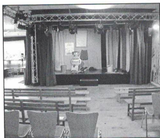
Theaterraum und Bühne

Jaro kommt aus dem Tschechischen und heißt Frühling – und ist außerdem seit über dreißig Jahren der Name eines Kinder-